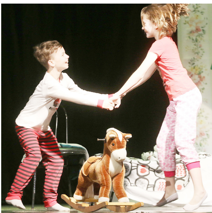
Трагикомедия «Беготня вокруг коня»