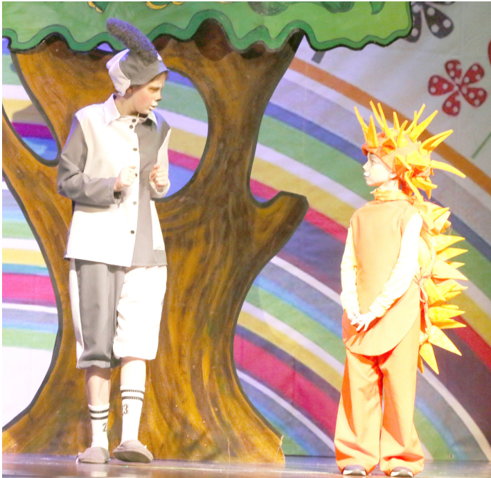
Музыкальная сказка «Оранжевый ёжик»