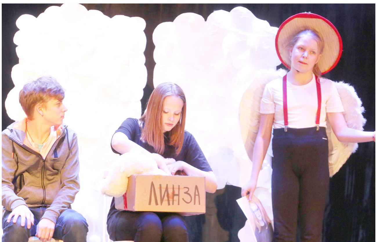
Драма «Летучкина любовь или 33 подзатыльника»

16 марта в подпорожском культурно-досуговом комплексе состоялся V открытый театральный фестиваль-конкурс «Подпорожские встречи». Юные актёры ТЮЗа и театров «Солнышко» и «Маска» представили на суд зрителей и жюри пять постановок – музыкальную сказку «Оранжевый ёжик», сказку «Кто такие птички», сказку-шутку «Колобок», трагикомедию «Беготня вокруг коня» и драму «Летучкина любовь или 33 подзатыльника».