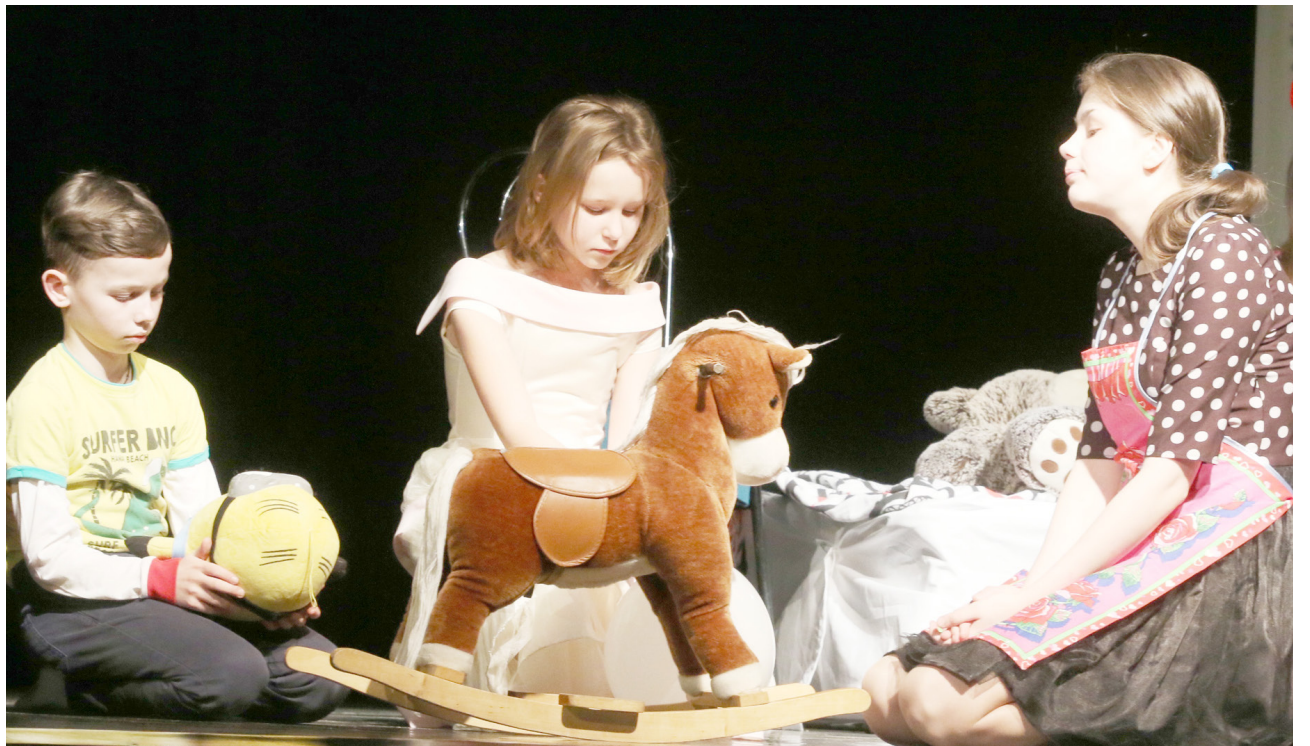
Трагикомедия «Беготня вокруг коня»