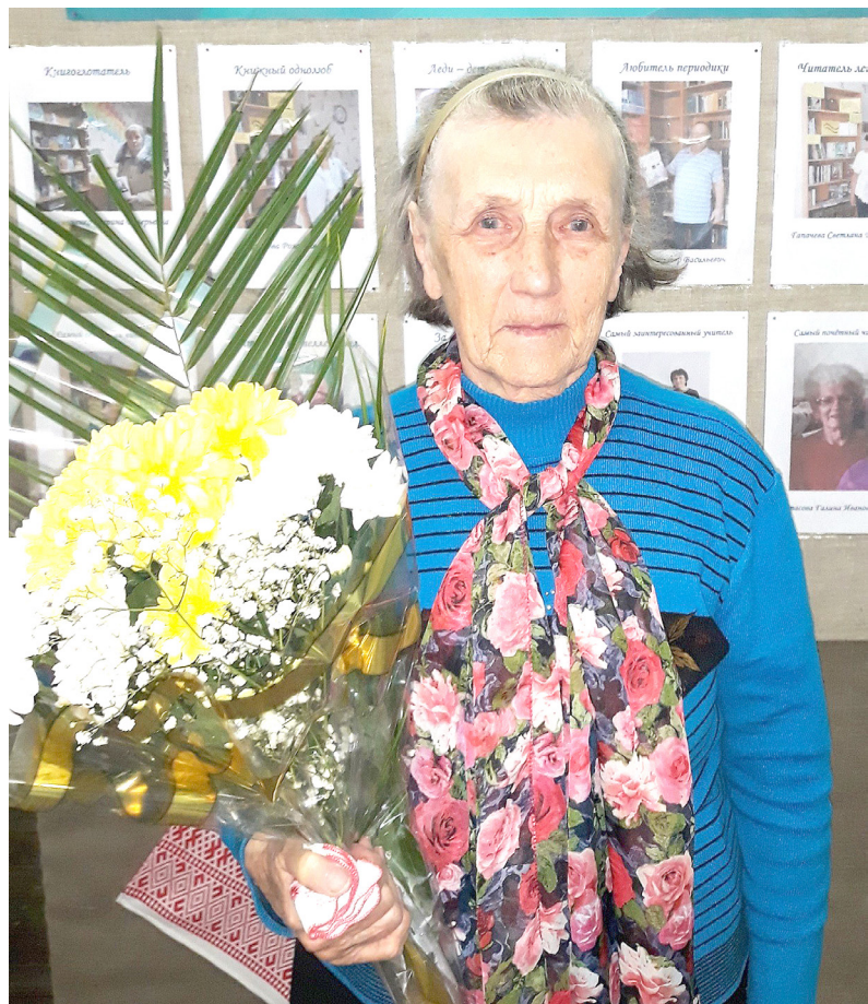
Г. Ф. Аспилляйтор

Коллектив МКУ «Винницкое библиотечно-культурное объединение»