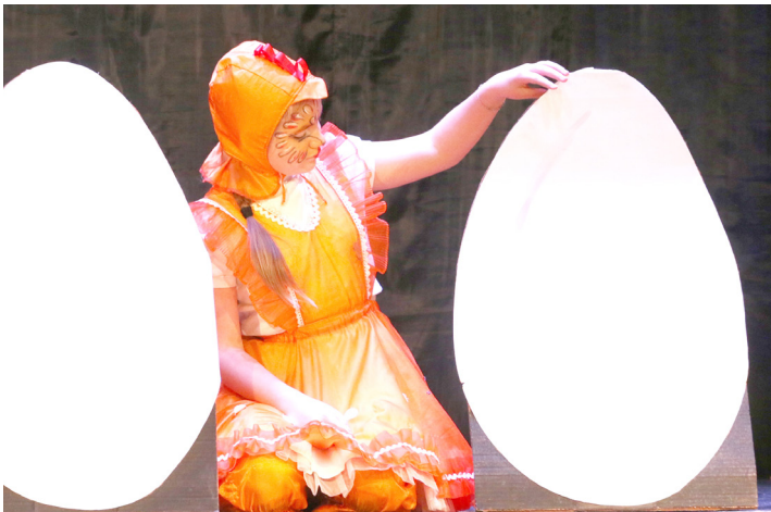
Сказка «Кто такие птички»